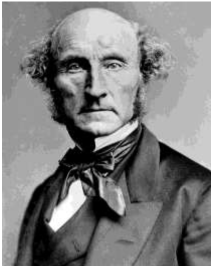
John Stuart Mill (1806-1873).