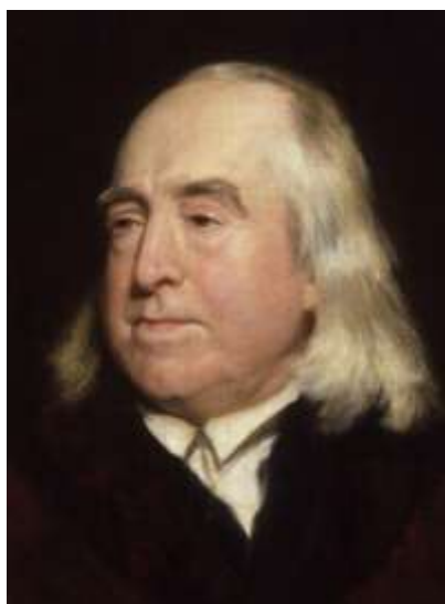
Jeremy Bentham (1748-1832) portréja.

Az angol szerző szerint a hasznosság a boldogságra és a fájdalomra épül. „Az emberi nem a fájdalom és az öröm kormányzata alatt áll – ez a hasznosság princípiuma..., ami az alapján helyesel vagy helytelenít egy tettet, hogy az az érintettek boldogságát növeli vagy csökkenti. Magánszemély cselekedetéről éppúgy szó van, mint kormányzati intézkedésről.” – írja Jeremy Bentham , az utilitarizmus atyja. (Bentham, 1977, 680-681.)