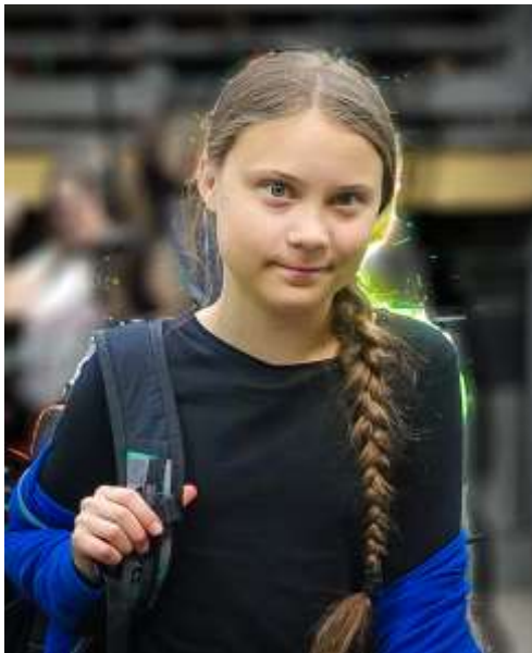
Greta Thunberg, 2019.

Ebből a generációs különbségből következik, hogy az idős politikusok számára – különösen a gyermektelen idős politikusok számára – a klímaváltozás csak egy absztrakt és távoli probléma, sok más probléma mellett, ami személyében nem érinti őt. Ráadásul gyakran érzik úgy, hogy más aktuális nehézségek jobban érdeklik a választók többségét.