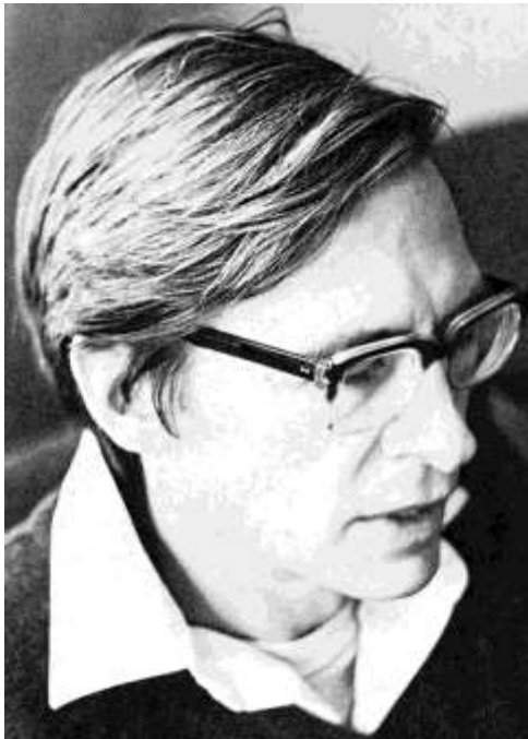
John Rawls, 1971.

Elméletében az igazságosság elve három ideához kapcsolódik, ezek a szabadság, az egyenlőség, és amit Rawls úgy nevez, hogy a közjóhoz való hozzájárulás fejében járó elismerés. Az első elv Rawls elképzelésének, az igazságosság elmélete liberális háttérének része, míg a második elv arra utal, hogy "az esélyek egyenlőtleniségének javítania kell a kevesebb eséllyel rendelkezők esélyeit" (Rawls, 1997, 362. o.). A második elv az egalitarizmus melletti kiállásként is felfogható. Rawls számára az igazságosság a társadalmi intézményekhez és gyakorlathoz kapcsolódó erényfogalom, függetlenül a személyektől és az egyedi cselekvéstől.