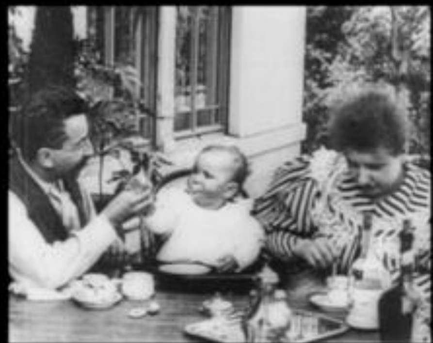
A kisbaba reggelije (Repas de bébé, 1895)