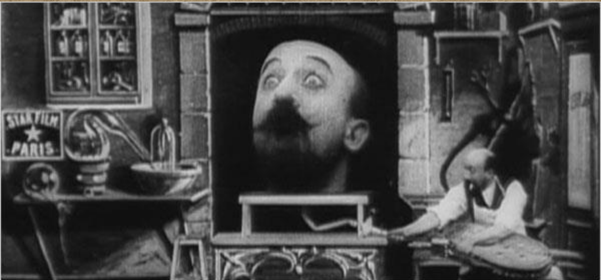
A gumifejű ember (L'Homme à la tête en caoutchouc, 1901–2)