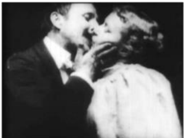
William Heise: A csók ( May Irwin Kiss , 1896)