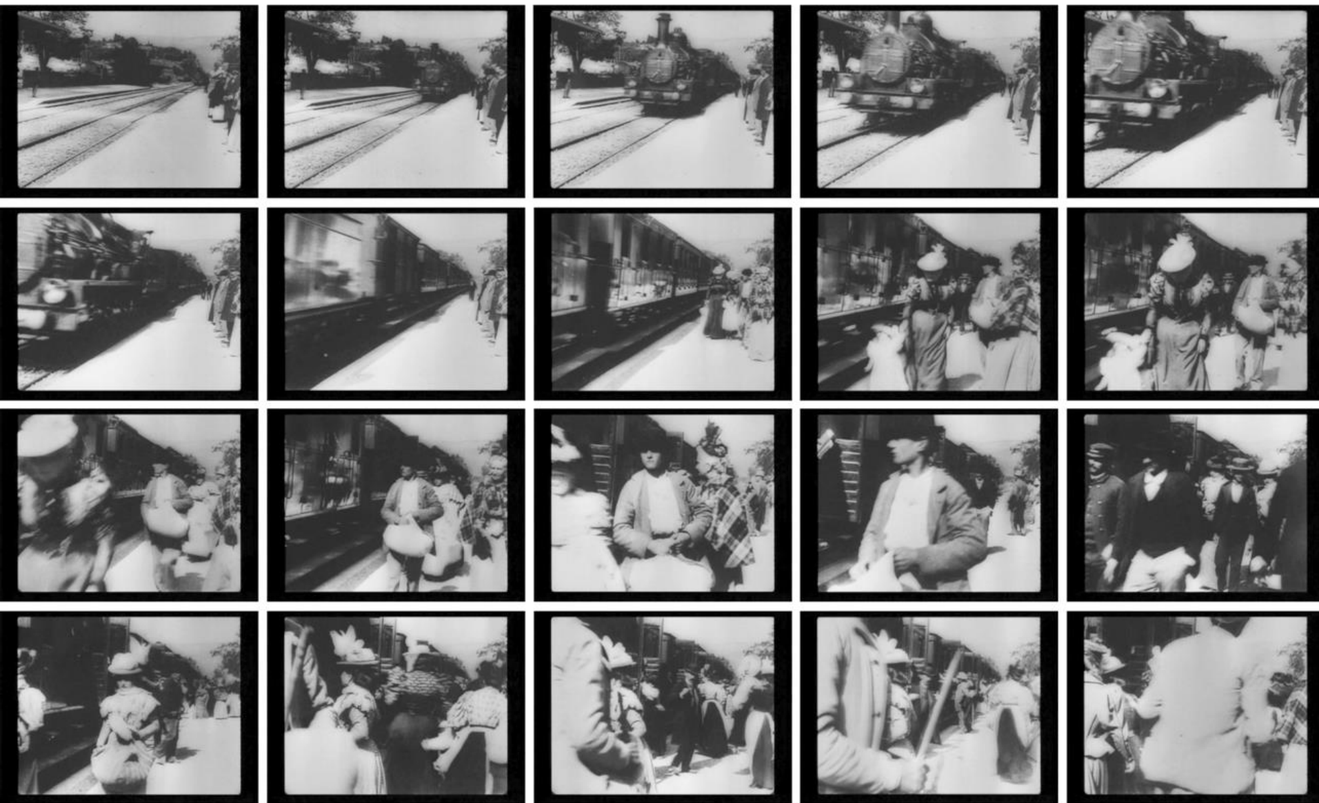
A vonat érkezése a Ciotat állomásra (L'Arrivée d'un train à la Ciotat, 1894)