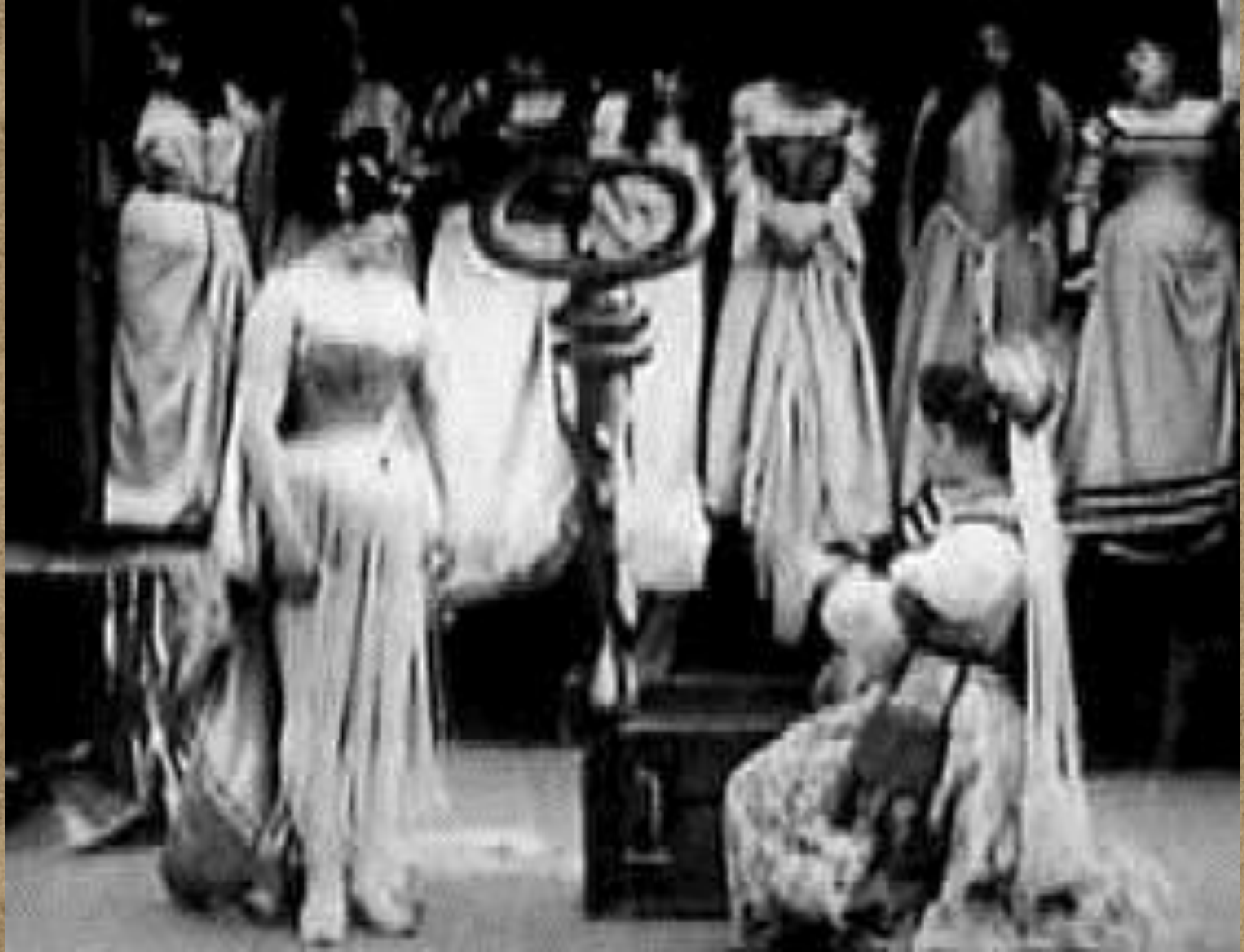
Kékszakáll (Barbe-bleue, 1901)