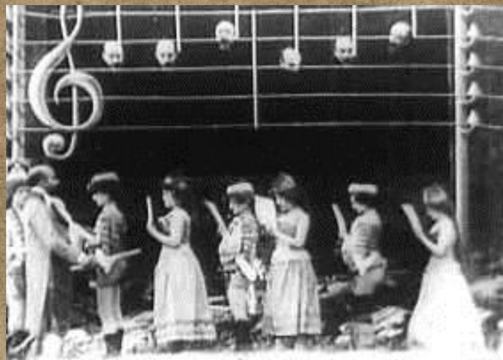
A zenebolond (La Mélomane, 1903)