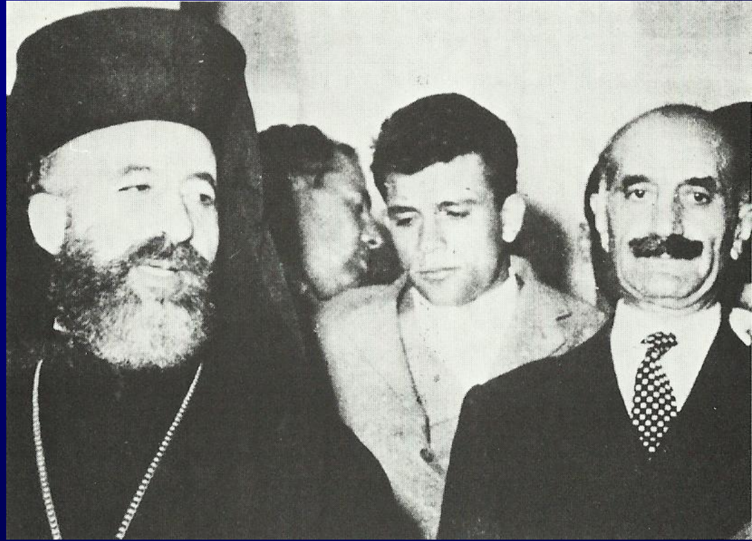
Makáriosz érsek és Jorgosz Grivász tábornok