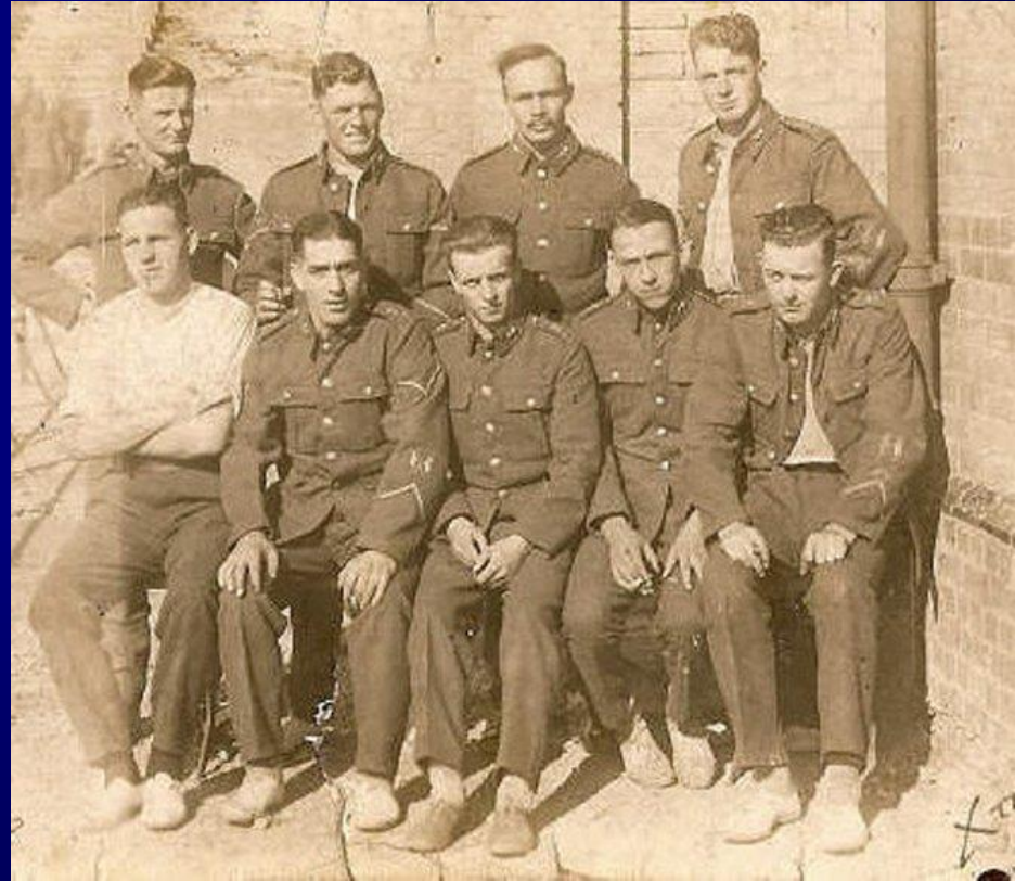
Brit katonai helyőrség Cipruson