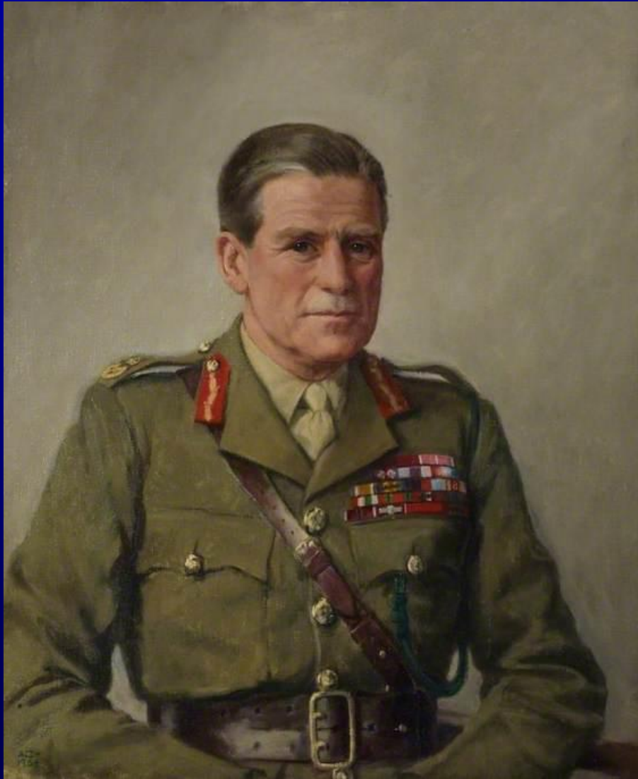
Sir John Harding