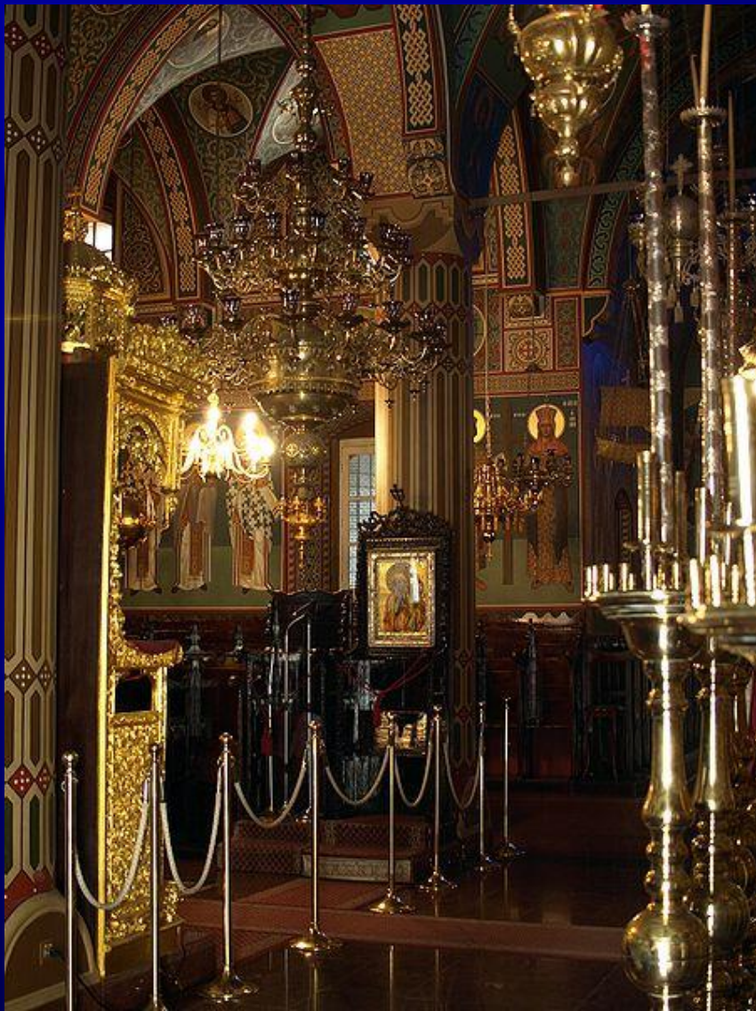
A Kikkói kolostor, az ortodox világ egyik leggazdagabb kolostora