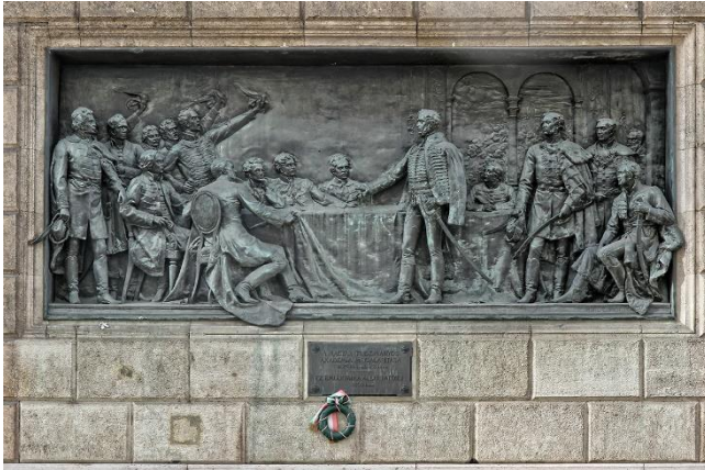
A Magyar Tudományos Akadémia homlokzata 6

A gazdaság- és jogtudományok tudomány-részterületen belül a következő tudományágakat különböztetjük meg: