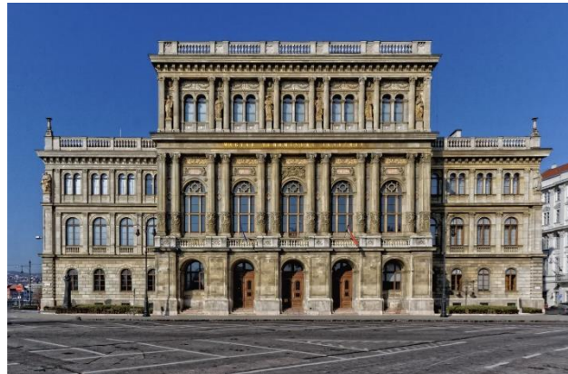
A Magyar Tudományos Akadémia székháza 4

A társadalomtudományokon belül a következő tudományágak léteztek: