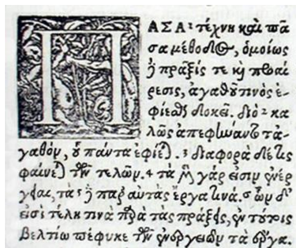
A Nikomakhoszi etika görög nyelvű kiadásának egy oldala

A család Arisztotelész szerint egyeduralmi jellegű. Csak egy szabad ember van a családban: a családfő, a többiek neki vannak alávetve. Állam akkor jön létre, ha a családok egységbe szerveződnek. Azonban Arisztotelész szerint az állam szabad és egymással egyenlő emberek közössége , azaz az államot a szabad és egymással egyenlő emberek alkotják. Ők az állam szabad polgárai , akik együtt határoznak az állam működéséről, akik állami tisztségeket betölthetnek, és akik választójoggal rendelkeznek. A szabadság így görög értelemben ugyanazt jelentette, mint polgárjoggal rendelkezni .