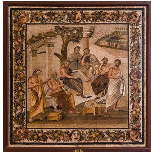
Platón Akadémiája egy pompejii freskón

Platón mestere Szókratész volt. Athéni polgárként Szókratészsel való találkozása előtt tragédiákat írt, Szókratész hatására lett filozófus. Szókratész elítélése és halála megrázta, ez az esemény több dialógusában is megjelenik. A demokráciából, ahol igaz embereket aljas indokkal és koholt vádakkal halálra lehet ítélni, teljes mértékben kiábrándult, és noha megtehetette volna, soha nem vállalt politikai szerepet Athénban . Az általa alapított Akadémia a görög világ leghíresebb filozófiai iskolája volt, ahol – többek között – Arisztotelész is tanult, és amely egészen Kr. e. 86-ig működött.