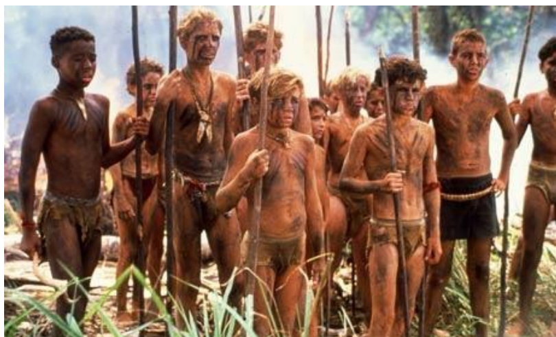
A legyek ura című film egy jelenete

Egy szabály azáltal lesz normává, hogy a közösség kötelezővé teszi annak betartását. Hogyan tud egy közösség kötelezővé tenni egy szabályt? Nyilvánvalóan saját hatalma révén. Korábban tisztáztuk, hogy a közösség kialakulása során elkerülhetetlenül létrejön a tagok egyéni hatalmából egy olyan közösségi hatalom , amely túlerőt képez minden egyes tag hatalmához képest. A közösség e hatalom segítségével tudja a szabályokat normává emelni . Ha valaki megszegi a szabályokat, nem tartja magát a normához, akkor a közösség szankcióval , büntetéssel sújthatja, aminek legegyszerűbb módja a kiközösítés.