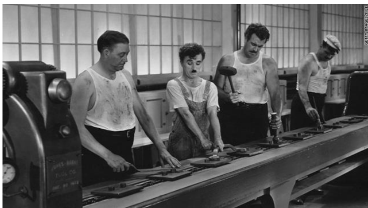
Charlie Chaplin: Modern idők (1936)

A kizsákmányolás láthatóan rendkívüli vagyoni különbségekhez vezet. Az egyik oldalon a tőke megsokszorozódása, a másik oldalon pedig a megélhetés nehézsége áll. A marxi megközelítésben a vagyoni egyenlőtlenségek rendkívül igazságtalanok, ezért ezt az igazságos társadalmi berendezkedés érdekében meg kell változtatni.