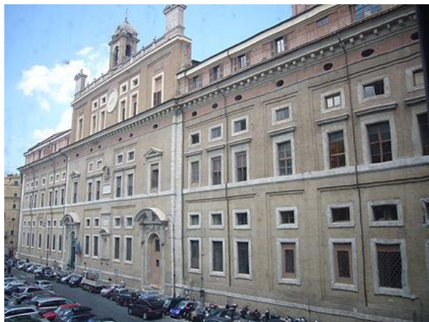
A Collegio Romano épülete Rómában

küzdelme Franciaországban (1562-1598). A szent Bertalan éj során Párizsban a katolikusok lemészárolták a béketárgyalásra érkező hugenotta főúri küldöttséget. A német fejedelemségekben a 17. században zajlott a harmincéves háború (1618-1648), amelyben több mint 8 millió ember pusztult el. Az egyházszakadás és a súlyos vallási konfliktusoknak jelentős szellemi következményei voltak: a nyugati kultúrában megrendült a katolikus vallás hegemoniája, ami kihatással volt a vallási eszmék iránti bizalomra is.