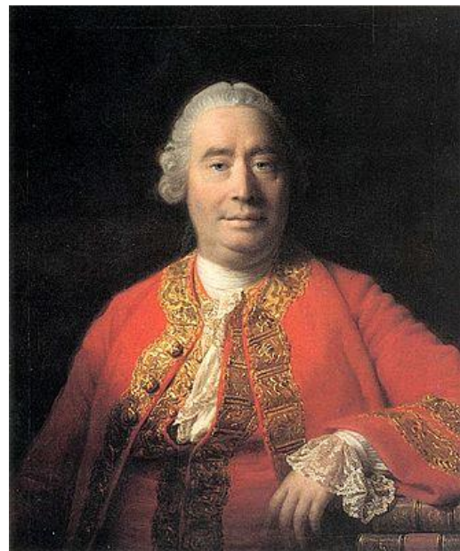
David Hume idősebb korában

Megjegyzés: A legegyszerűbb (barbara típusú) szillogizmus ez: (p1) Minden ember halandó. (p2) Szókratész ember. (k): Szókratész halandó. Ez esetben az ember, Szókratész és a halandóság ideái között létesítettünk kapcsolatot. Hume szerint az ideák közötti kapcsolatoknak, amelyeken minden következtetés alapul, három formája van: (1) hasonlóság , (2) időbeli vagy térbeli érintkezés és (3) ok-okozati