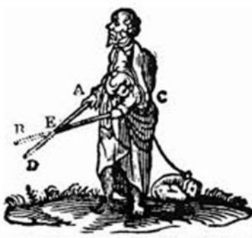
Illusztráció Descartes Dioptrika (1636) című művéből

Descartes szerint nem végesen sok (Arisztotelész), hanem csak két szubsztancia van: a