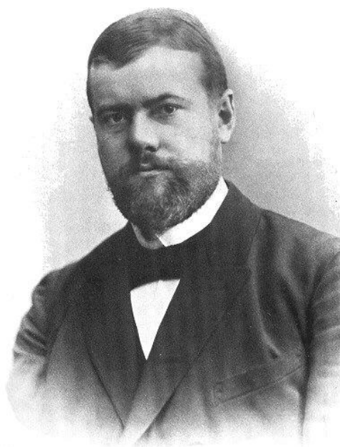
Max Weber 1894-ben

Tehát a célracionalitás szerint a célok nem racionális eljárások eredményeként alakul ki, hanem azok valamiképpen (pl. Isten, természet, társadalom révén) adottak az emberek számára. Az instrumentális vagy cél-eszköz racionalitás fogalmát először Arisztotelész határozta meg.