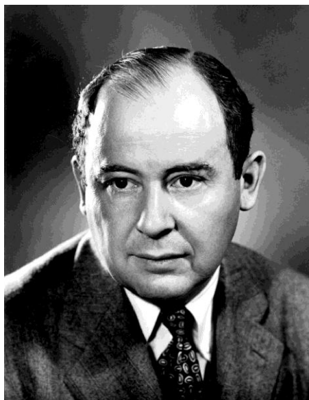
Neumann János az 1940-es években

A játékelmélet a közgazdaságtudomány egyik segédtudományaként született meg, ahogy azt Neumann János és Morgenstein korszakalkotó könyvének a címe is mutatja. Ennek megfelelően kezdetben a játékelméletben is az önérdék ( minimax elv , majd Nash-egyensúly ) követése jellemző.