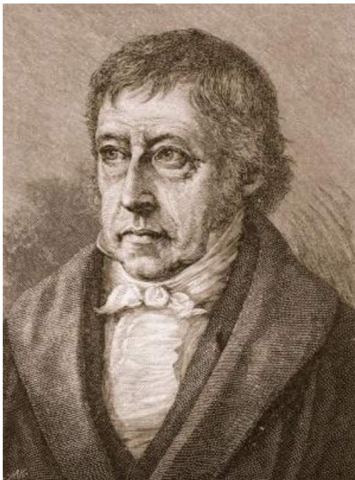
Georg Wilhelm Friedrich Hegel (1770-1831)

A fentiek is jól mutatják, hogy a racionális fogalom jelentése nem egyértelmű. A kifejezés használata sem egyértelmű. A racionális fogalom sokszínű jelentését legegyszerűbben a különböző tudományokban használt értelmezések jelzésével mutatható be. A társadalomfilozófiai szempontból releváns racionalitás értelmezésekre koncentrálok.