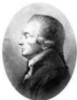
S. Maimon (1753-1800)

J.G. Fichte (1762-1814) – Elfogadja Reinhold kritikáját, és a kanti filozófiát egy azonosság-filozófia felé viszi tovább. Az Identitätsphilosophie (azonosság-filozófia) abból az alaptételből indul ki, hogy az egyetlen előfeltétel nélküli alap az Én (Ich), pontosabban az a kijelentés: Én=Én. Filozófiája a tudománytan (Wissenschaftslehre). Kezdetben nagy hatással van Schellingre, akit a tudománytan második megalapítójának is nevez. Reinhold, Fichte és Schelling is (egymást követően) a Jénai Egyetem tanárai.