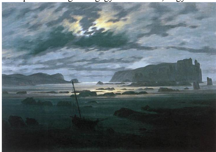
Caspar David Friedrich: Az Északi-tenger holdfényben, 1823-24

A szép és a fenséges megegyeznek abban, hogy mindkettő önmagáért tetszik.