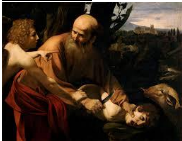
Caravaggio: Izsák feláldozása, 1595