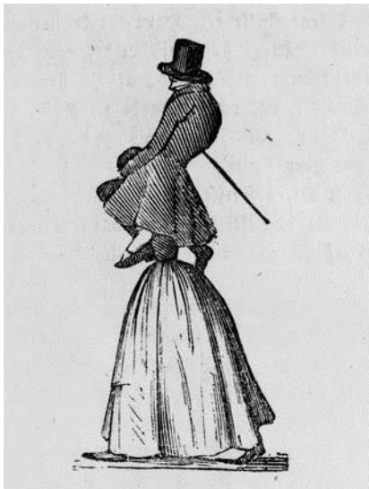
Gúnyrajz a Corsaren című lapban Kierkegaard-ról