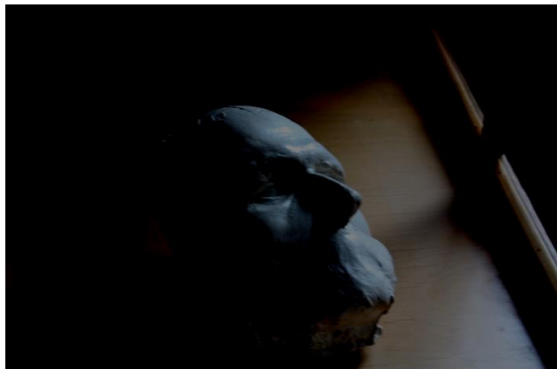
Nietzsche halotti maszkja Weimarban

Nietzsche legfontosabb filozófiai fogalmai