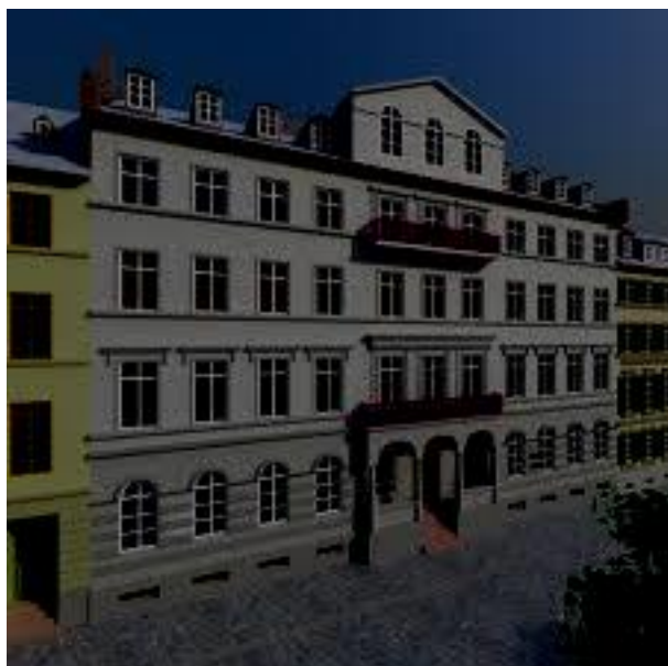
Schopenhauer háza Frankfurtban

„A büszkeség legolcsóbb fajtája a nemzeti büszkeség. Aki ugyanis ebben szenved, az önmagáról menten elárulja azt, hogy semmi olyan személyes jó tulajdonsága nincs, amivel büszkélkedhessék, különben nem nyúlna olyan valamihez, amiben annyi millió emberrel kell osztozkodnia. Aki számos személyi kiválósággal van felruházva, saját nemzeti hibáit inkább felismeri, mert azokat mindig szem előtt látja. Viszont minden szánandó, balga, akinek semmije sincs a világon, amire büszke lehetne, mint utolsó eszközhöz, a nemzethez folyamodik, amelynek tagja, s nemzete hibáinak és ostobaságainak, öklével és sarkával legerősebb védelmezőjévé csap fel. A. Schopenhauer Sämtliche Werke 4. Philipp Reclam: Leipzig, 1844. 404.o.