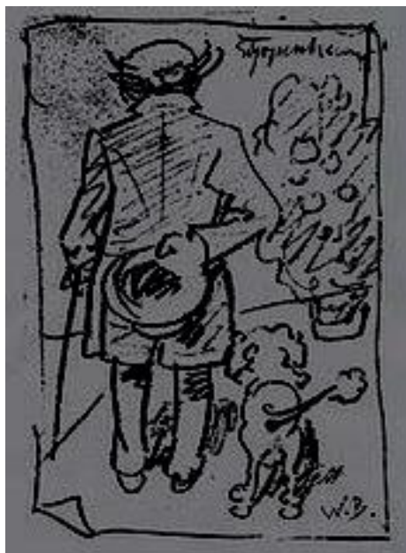
Schopenhauer és „Atman” nevű kutyája