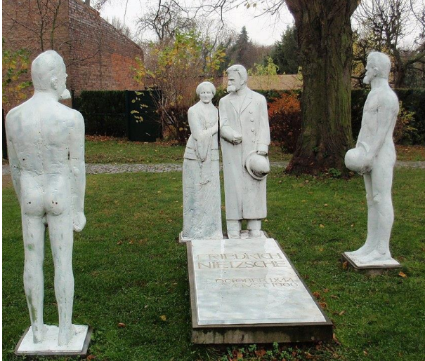
A röckeni síremlékmű (Röckener Bacchanal)