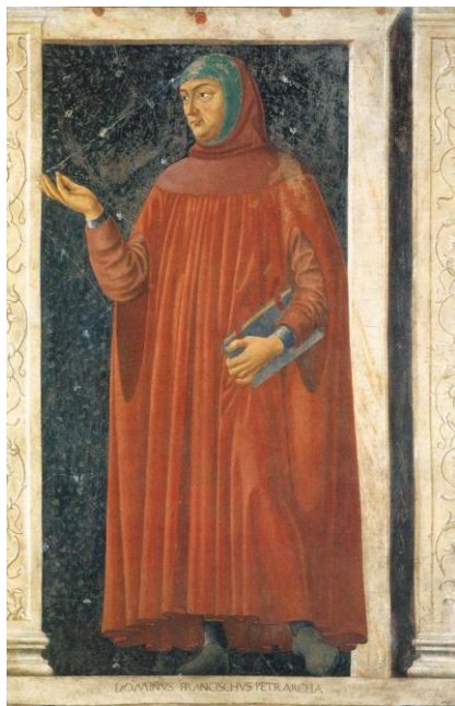
Francesco Petrarca (1304-1374) Andrea di Bartolo di Bargilla műve 1450 körül Firenze, Uffizi

soha nem látott precizitását (innen a kortárs analitikus filozófia érdeklődése a kései skolasztika iránt), másfelől azonban soha senki nem beszélte ezt a nyelvet az egyetem falain túl.