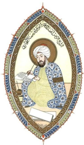
Avicenna ábrázolása egy perzsa miniatúrán

A skolasztika virágkorának filozófiáját döntően meghatározta Arisztotelész filozófiai műveinek megjelenése a latin nyelvű nyugaton.