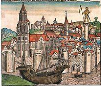
Párizs látképe az 1493-as Nürnbergi krónikában

Eközben a 12. század nagy társadalmi változásokat hoz Európában. Elterjed az írásbeli adminisztráció, racionalizálódik a mezőgazdasági termelés, de mindenekelőtt az a szociológia-történelmi fejlemény bír filozófia-történelmi jelentőséggel, hogy az európai városok expanziója minden addigi mértéket meghalad a 13. századra.