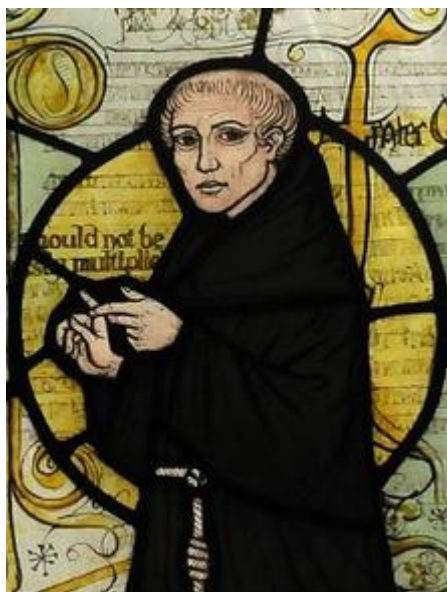
William Ockham (1285-1348) – a kései skolasztika legjelentősebb gondolkodója

A skolasztika virágkorának vezető gondolkodói meg voltak győződve arról, hogy mintegy rajtatartják ujjukat a társadalom ütőerén. Az egyetemeken oktatott filozófia azonban valamikor a 13-14. század fordulóján elveszíti társadalmi küldetésének e magától értetődőségét. Az egyetemi filozófiai viták belterjessé válnak, a filozófiai kérdések finomra hangolása egyben az egyetem és a társadalmi környezet viszonyának problematikussá válását is jelenti egyben. A kései skolasztika kidolgoz egy technikai jellegű latin nyelvet, mely egyfelől lehetővé tette a tudományos problémakezelés és kommunikáció szinte