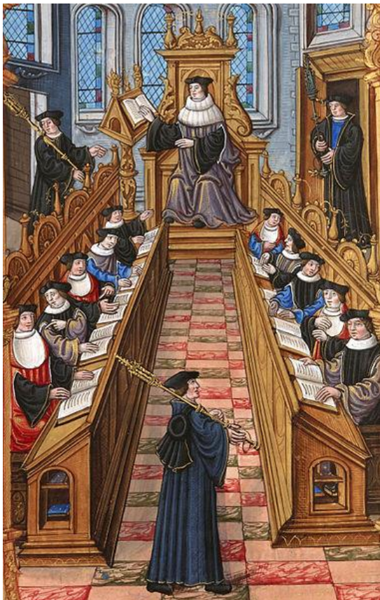
A tanítók gyűlése a párizsi egyetemen Étienne Colaud Chants royaux című kéziratában (16. század eleje)

Mivel a társadalom elitjét adó teológiai és jogi képzésben résztvevőinek is először el kellett végezniük az artes fakultás alapozó kurzusait, így a bölcsészkar oktatói jelentős társadalmi befolyásra tettek szert. Részben ez volt az oka annak is, hogy Arisztotelész műveinek recepciója nem volt zökkenőmentes: az egyházi hatóságok a 13. század folyamán többször is kísérletet tesznek az arisztotelianus filozófia terjedésének korlátozására. Ezeket elítélő határozatok formájában ismerjük, ezek közül a legismertebb az ún. 1277-es párizsi elítélő határozat, mely 217 antik-pogány eredetű tézist ítél el.