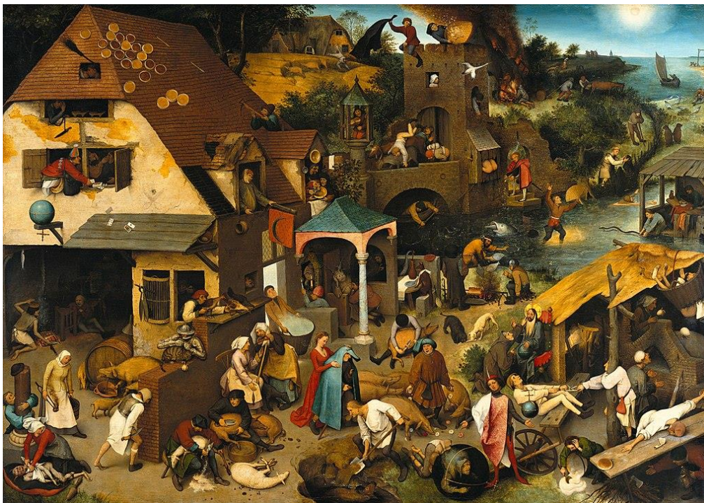
Bruegel: Flamand közmondások (1559) Berlin Staatliche Museen

A közmondások és szólások e kultuszának talán leghíresebb műve a korai Breugelhez köthető: