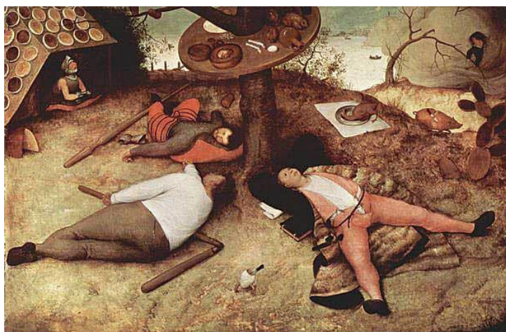
Bruegel: Schlaraffenland (1667) München, Alte Pinakothek

Pieter Bruegel (ca. 1525-1569) és a közmondások