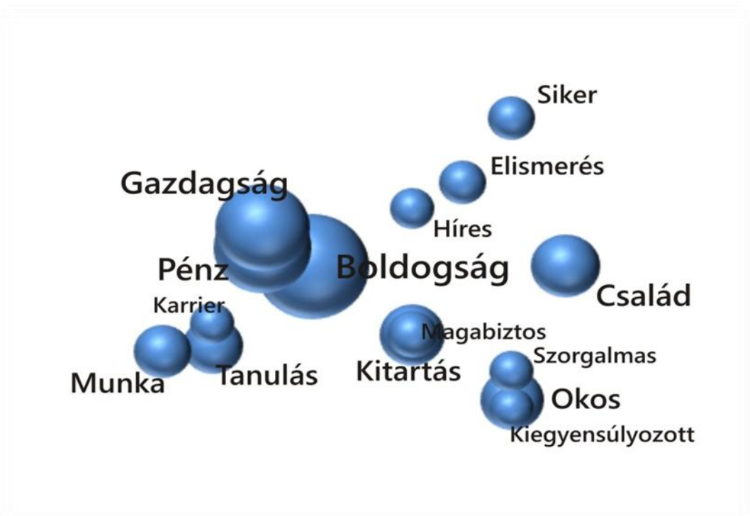
1.sz ábra A sikeres ember fogalmának szemantikus térképe (központi mag és elsődleges periféria)

fogalom jelentésének központi magját. A sikeres ember fogalmának elsődleges asszociatív kapcsolatait az 1. sz ábra szemlélteti.